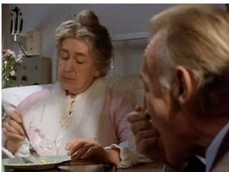
1988 MADAME SOUSATZKA (Madame Sousatzka) de John Schlesinger