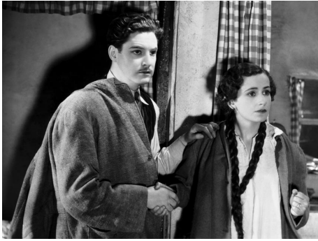
1935 LES 39 MARCHES (The Thirty-Nine Steps) d'Alfred Hitchcock avec Robert Donat