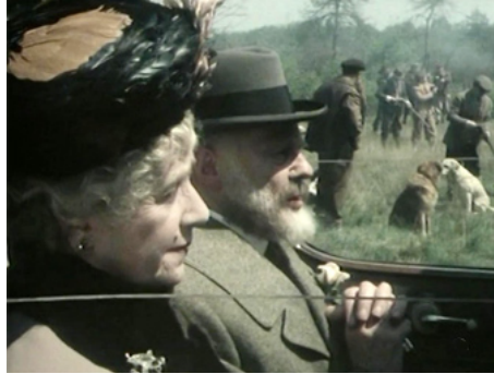
1978 EDWARD & MRS SIMPSON de Waris Hussein avec Marius Goring