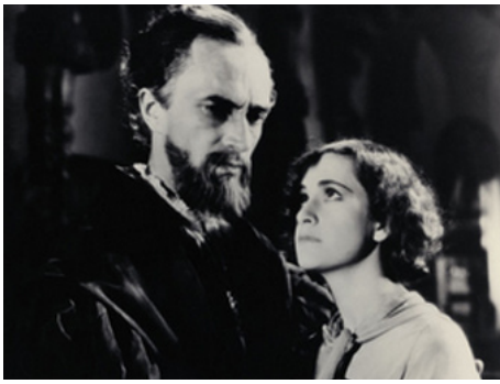
1933 LE JUIF ERRANT (The Wandering Jew) de Maurice Elvey avec Conrad Veidt