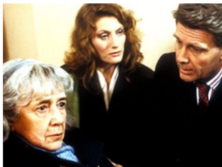
1989 SHE'S BEEN AWAY de Peter Hall avec Geraldine James, Edward Fox