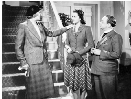
1941 MARIAGE SANS HISTOIRES (Quiet Wedding) d'Anthony Asquith avec Margaret Lockwood