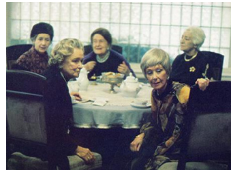
1973 LE PIÉTON (Der Fußgänger) de Maximilian Schell avec L. Dagover, K. Haacke, E. Bergner, F. Rosay