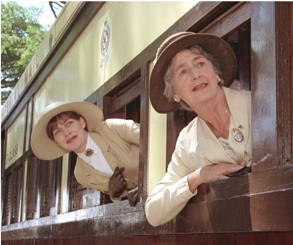
1984 LA ROUTE DES INDES (A Passage to India) de David Lean avec Judy Davis