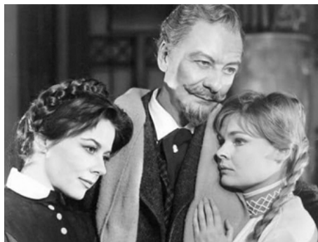
1962 THE CHERRY ORCHARD de Michael Elliott avec John Gielgud, Judi Dench