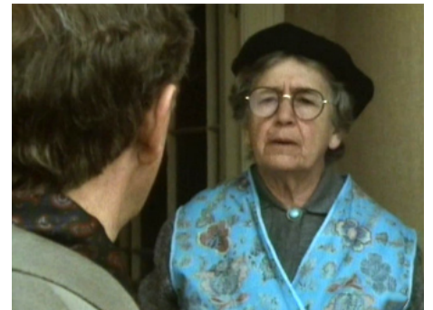
1987 UN ESPION PARFAIT (A Perfect Spy) de Peter Smith avec Peter Egan