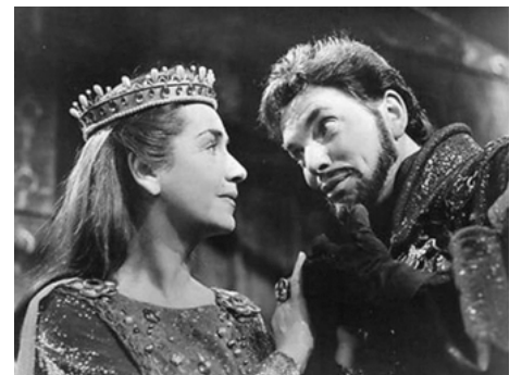
1965 LA GUERRE DES ROSES (War of the Roses) de Peter Hall & Michael Hayes avec William Squire