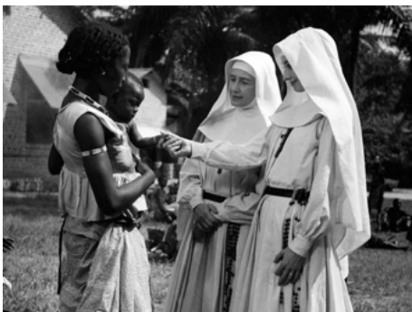
1959 AU RISQUE DE SE PERDRE (The Nun's Story) de Fred Zinnemann avec Audrey Hepburn