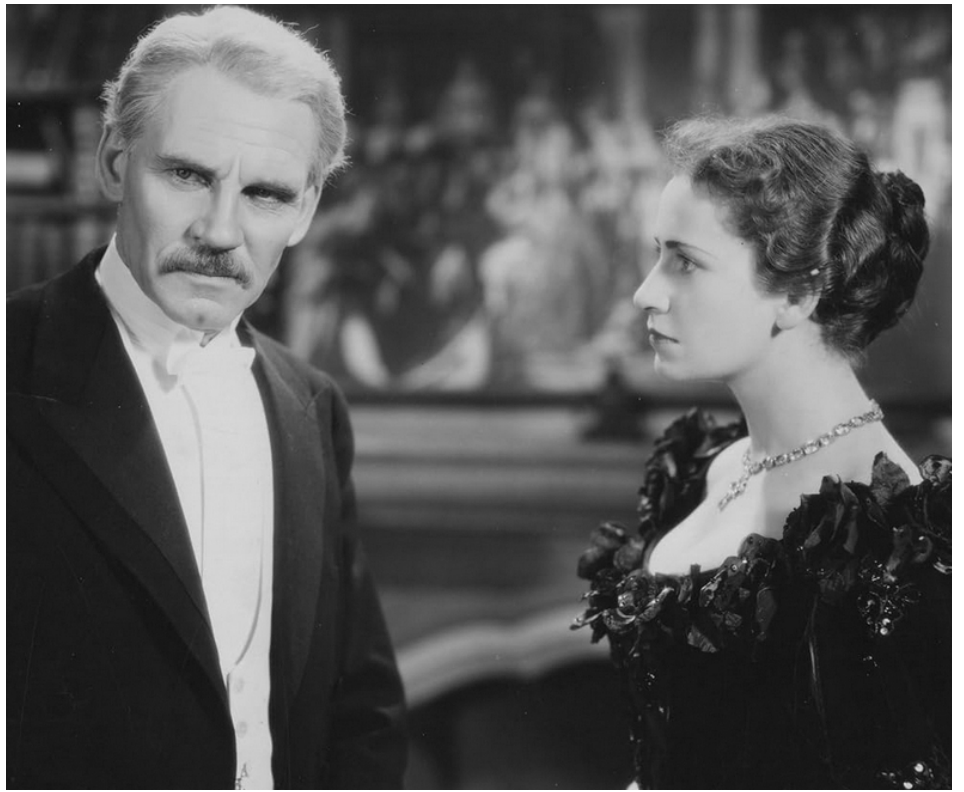
1936 RHODES OF AFRICA de Berthold Viertel et Geoffrey Barkars avec Walter Huston