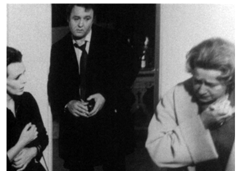
1969 AUTO-STOP GIRL (Three Into Two Won't Go) de Peter Hall avec Claire Bloom, Rod Steiger