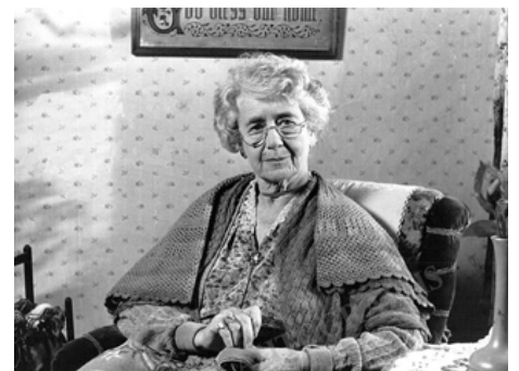
1989 LA CHALEUR DU JOUR (The Heat of the Day) de Christopher Morahan