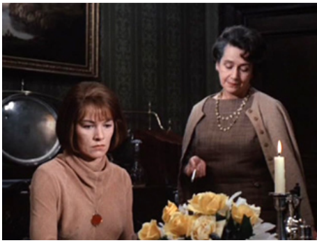
1971 UN DIMANCHE COMME LES AUTRES (Sunday Bloody Sunday) de John Schlesinger avec G. Jackson